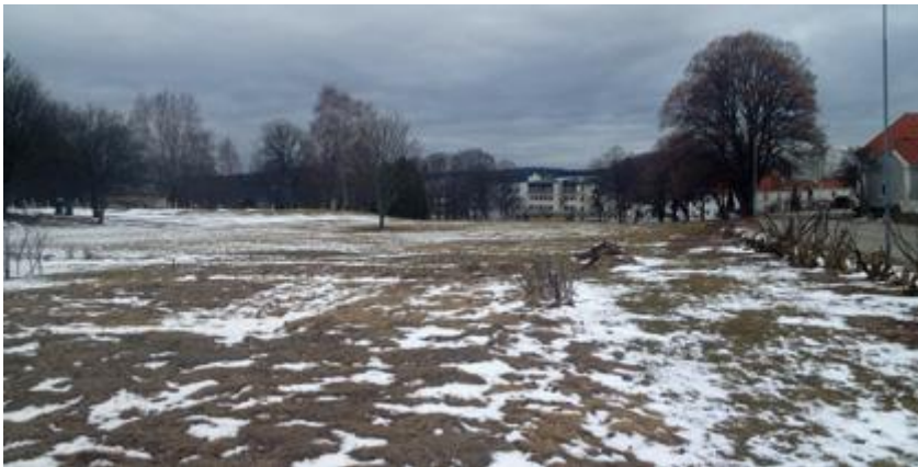
Os-jordene i dag.

tidligere krongodset Ous (i dag: Os), som ble benyttet til tobakksproduksjon. Faksimile fra boka "Fra den gang oldemor var ung, Fredrikshald - glimt". Baardsen & Co, A.s, Halden av Frank Kiel Jacobsen, 1985.