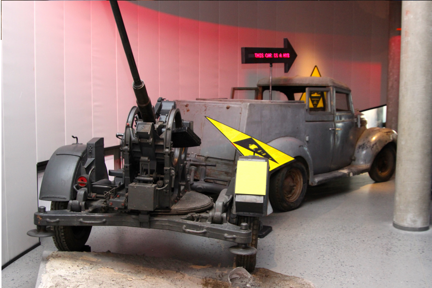
Til venstre: 20 mm luftverkanon «Oerlicon» trukket av en liten lastebil.