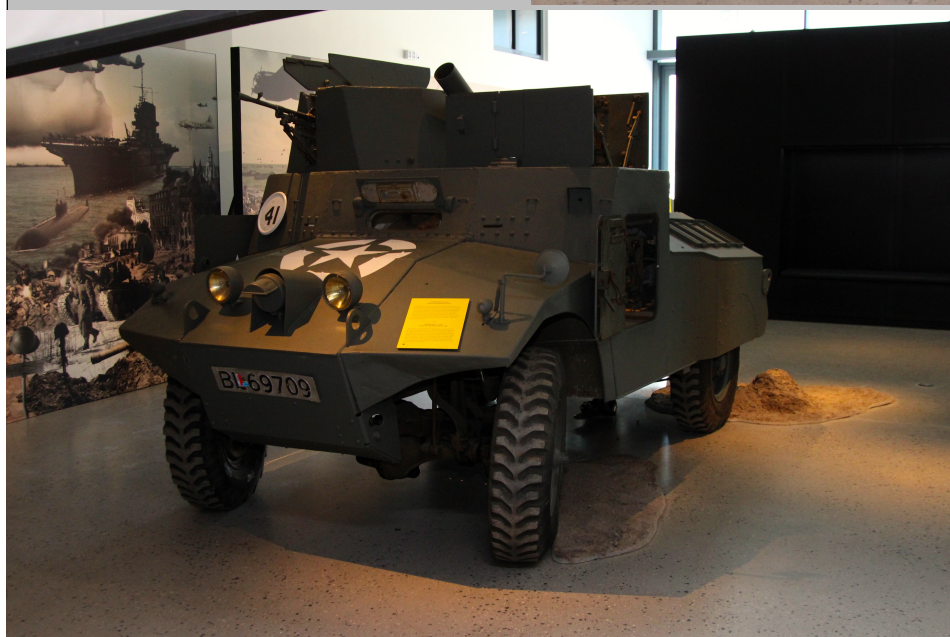
Venstre: Lett pansret vogn MORRIS MARK II 4X4