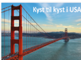
Kyst til kyst i USA

MEDLEMSPRIS FRA KUN KR 9 360 p.p / 12 625 p.p