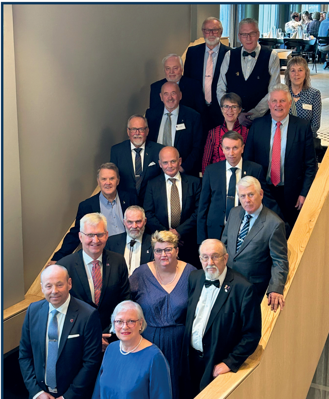
Forbundsstyret Forsvarets Seniorforbund 2023 – 2025