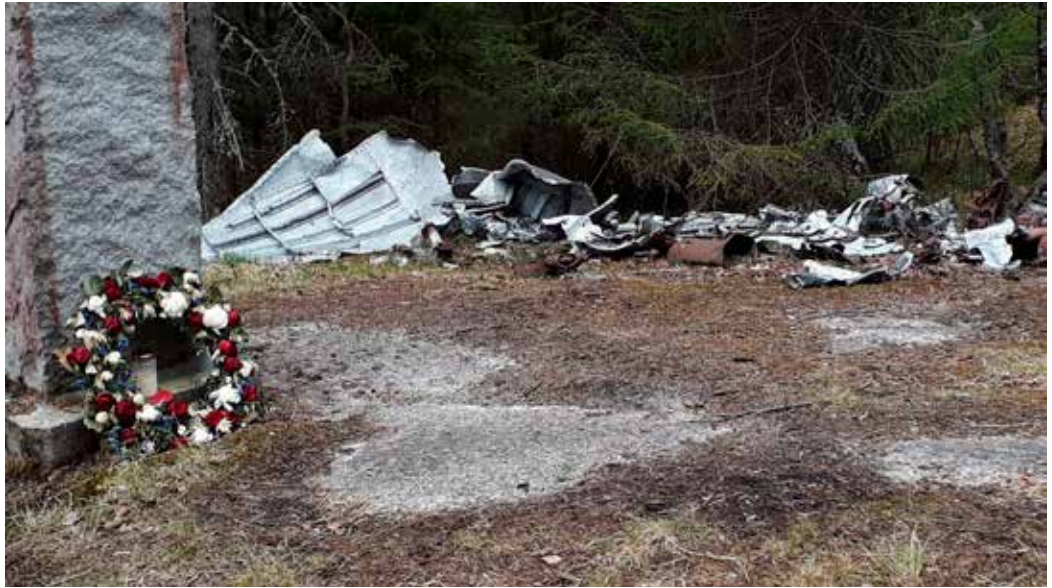
Sørkedalen: Minnesmerke og vrakrester fra flyet som styrtet i Sørkedalen 10. mai 1945.