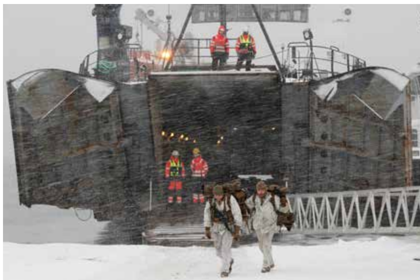
Marines fra US Marine Corps under en landsetningsoperasjon på vinterøvelsen Cold Response 2020.

FOH i tettere inngrep med NATO kommandoer er utvilsomt erfaringer høstet gjennom større øvelser de tre siste år. Trident Javelin i 2017, Trident Juncture i 2018 og Trident Jupiter i 2019. Fra å måtte forholde seg til kart som ikke gikk langt nok mot nord til å dekke Reitan, har FOH nå fått en plass på organisasjonskart, med roller og ansvar. Riktignok kun i øvelseskontekst, men det er en god