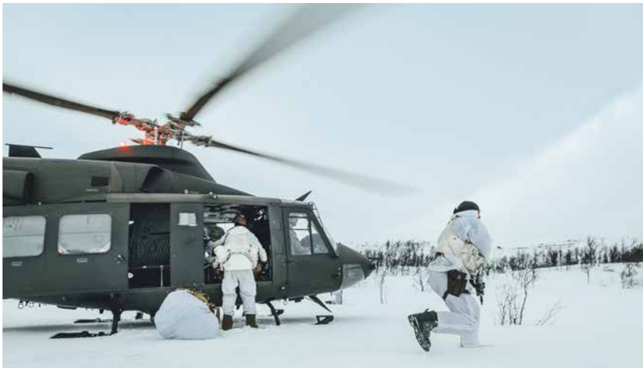
Feltoperatører fra Fjernoppklaringseskadronen i Etterretningsbataljonen samtrenner med kolleger fra US Marines og 339-skvadronen i Luftforsvaret, under den multinasjonale vinterøvelsen Cold Response 2020 i Troms.