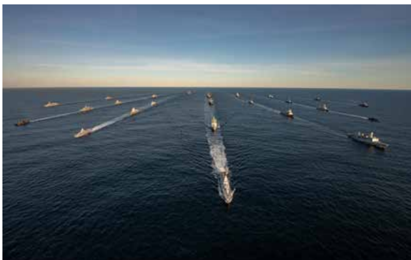
25 fartøy i formasjon under øvelse Trident Juncture i 2018.

FOH har ansvar for å behandle bistandsanmodninger fra politiet og kan avgjøre støtte til andre sivile etater. Denne prosessen er innøvd og kontakten med aktuelle sivile aktører fungerer veldig godt hvor det blant annet er etablert liaisonavtale med 17 ulike offentlige sivile etater.