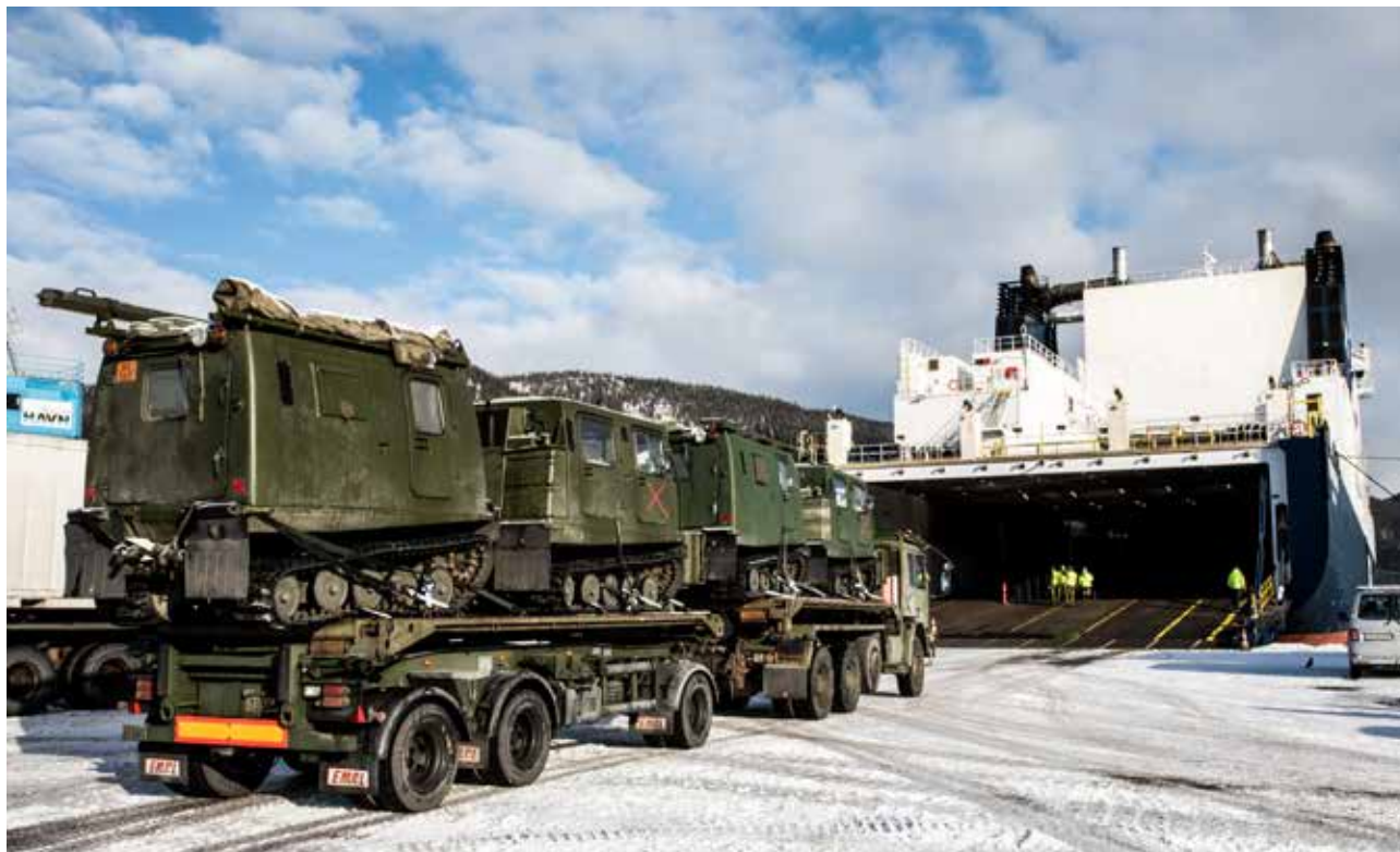
Forsvaret samarbeidet med totalforsvaret for å frakte materiell til øvelse Cold Response. Her blir materiell fraktet inn på et skip Orkanger.

og substansielt. Det samme gjaldt når enkeltland begynte å utvikle planer for egen virksomhet i Nordområdene. Slutttilstanden er at forsvarsplanlegging har ført FOH i betydelig tettere inngrep med NATO kommandoer og enkelte nasjonale hovedkvarter. Denne effekten finner man hovedsakelig i siste halvdel av perioden, og dette er pågående virksomhet.