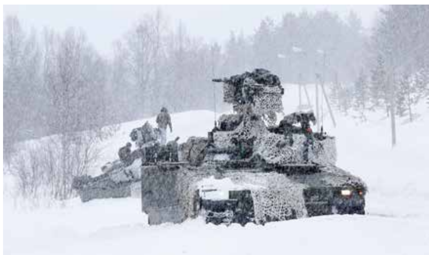
CV9030N stormpanservogn med Remote Weapon Stations fra Telemark bataljon under taktisk tilbakefytting under vinter øvelsen Cold Response 2020.

Under J-3 ligger Joint Operation Center (JOC) og Overvåkingssenteret. Joint Operation Centre er innslagspunktet for alle daglige militære operasjoner. Det er også her bistandsanmodningene mottas. I det felles operasjonssenteret er alle funksjonene i hovedkvarteret representert. Overvåkingssenteret benytter ulike sensorer som fartøy, kystradarkjeden,