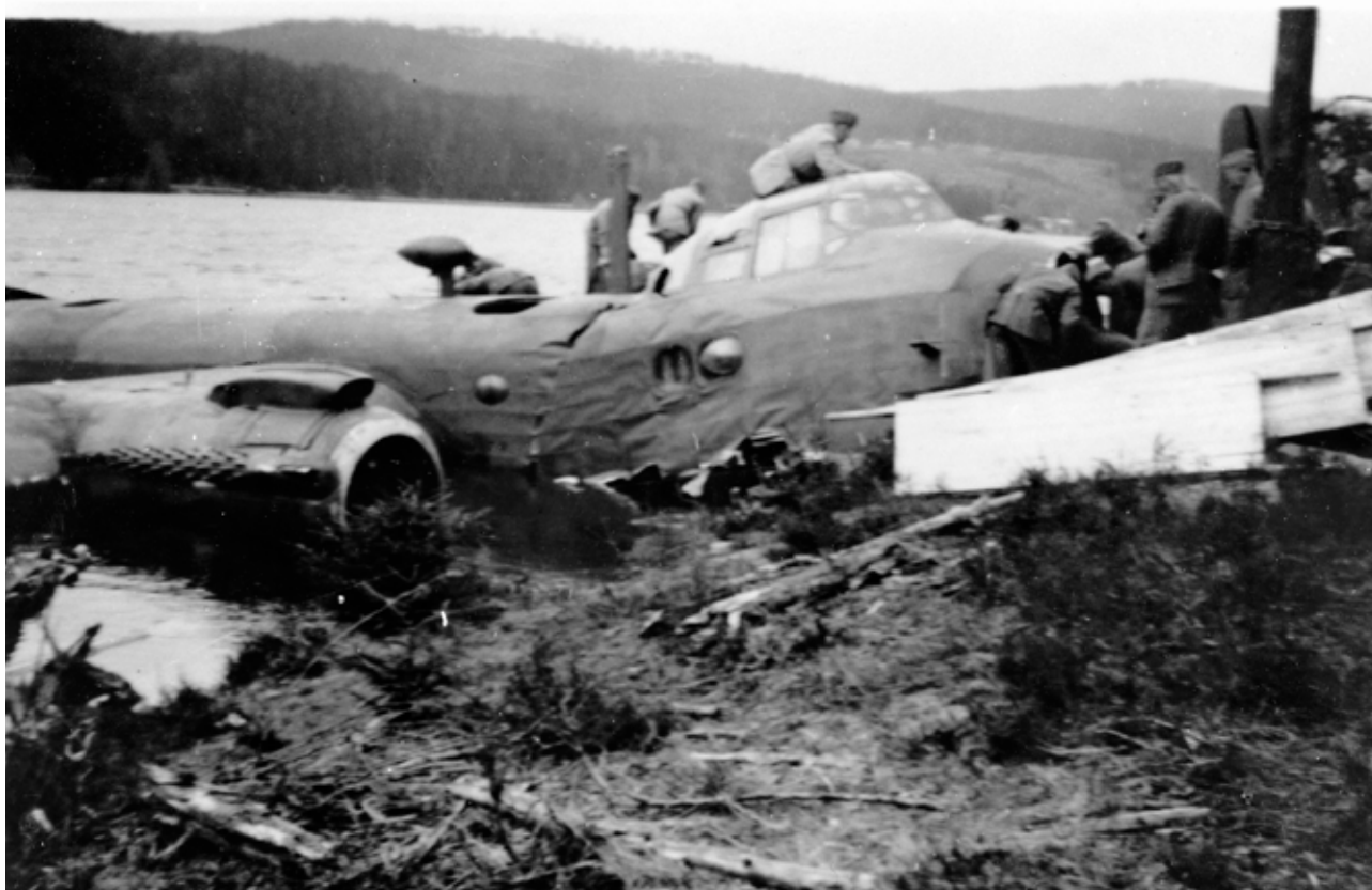
Nødlanding: Dette britiske flyet av typen Short Sterling måtte nødlande på sjøen Store-Rögden i Sverige 10. mai 1945. Fire britiske fallskjermssoldater omkom.

10. mai. Signalene fra Eureka navigasjonstransponderen på Gardermoen var svake og til liten hjelp for at flyet skulle finne innflygingsruta. Været var elendig. Robertson forsøkte trolig også å finne et hull i skydekket, men tåka lå lavt over åsene i Nordmarka. Rundt klokken ti norsk tid traff flyet den 417 meter høye Andstjernåsen nord i Sørkedalen.