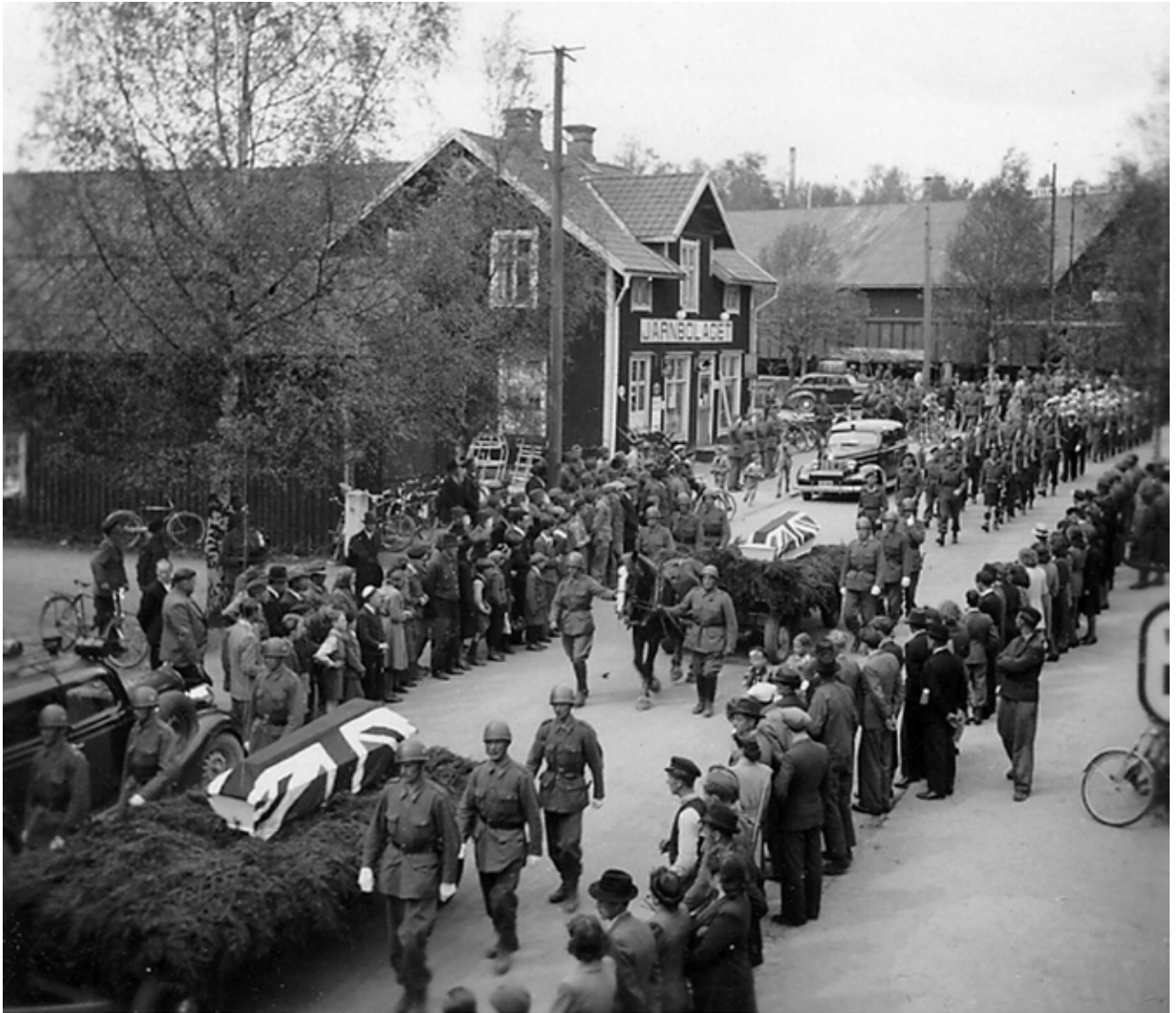
Begravelse: De fire britiske soldatene som omkom ble fulgt til graven av lokalbefolkningen i Torsby, og med full militær æresbevisning.

Den allierte kapitulasjonsordren befalte at tyske styrker skulle forlate kystvern batterier, luftvern batterier og større byer, og samles i nærmere definerte områder. Alle tyske styrker skulle også trekke minst 50 km bort fra grensa mot Sverige.