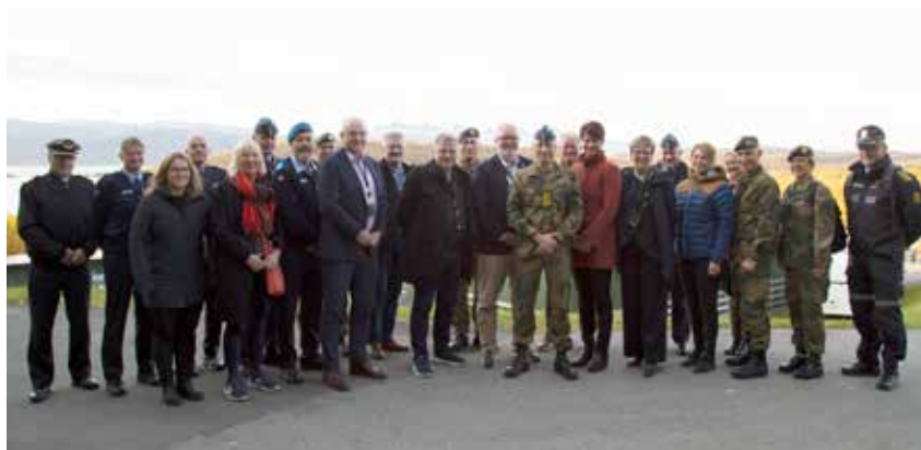
FOH får mange besøk i løpet av året. Her er regionalt totalforsvarsmøtet på besøk.

Planlegging har direkte og indirekte hatt stor betydning for FOH og Forsvaret for øvrig. Den umiddelbare effekten er at vi om lag i midten av 10-året hadde planer for forsvar i fred, krise og krig. FOH besluttet å arbeide mot «plug and play» i forhold til NATO strukturer. I praksis betød det en gjenkjennbar organisering, gjennomføring av forsvarsplan-