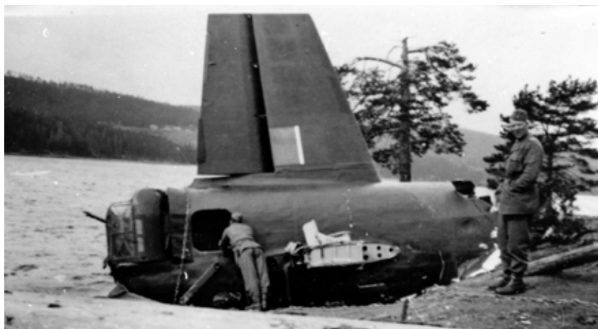
Brakk av: Halepartiet på det britiske flyet brakk av og sank da flyet traff vannflaten med stor kraft. Svenske militære kom raskt til stedet.

ikke ble holdt tilbake på grunn av det dårlige været, som nå var kjent blant flykontrollørene. Tretten av flyene returnerte til Storbritannia da de ikke greide å lande i Norge. Ett fly greide å lande på Gardermoen. Det siste flyet kom nesten fram. Det styrtet ved Lyshaug gård i Nannenstad, bare