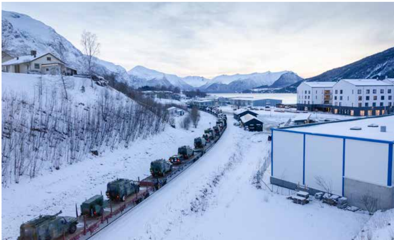
En viktig del av de større vinterøvelsene er å trene på alliert mottak. Her fraktes materiell med tog til Cold Response 2020.

fly og rombaserte sensorer til å følge med på fartøy som seiler inn og ut av Norges ansvarsområdet langs norskekysten. I tillegg til å følge med på militær trafikk samarbeider overvåkingssenteret tett med sivile etater som Politiet, Tollvesenet, Kystverket, Tolletaten, Kystverket og Sjøfartsdirektoratet. Overvåkingssenteret overvåker skipstrafikken og gjennomfører