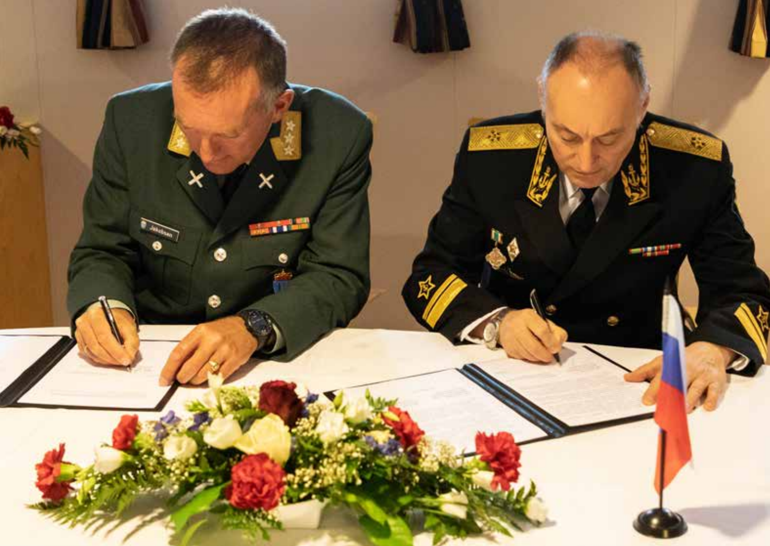
Forsvarets operative hovedkvarter samarbeider fortsatt med FSB. Bildet er fra et fartøysbesøk i 2018.

I dag har Norge litt i overkant av 500 personer i tjeneste for NATO, internasjonale operasjoner og annen internasjonal tjeneste.